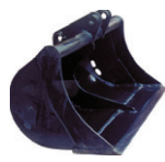
BENNA PULIZIA FOSSI