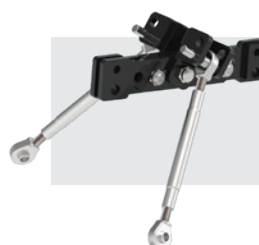
Telaio irrigidimento al trattore categoria 1 - Incluso