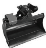
BENNA ORIENTABILE 45°