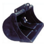
BENNA PULIZIA FOSSI

250 mm 300 mm 400 mm 500 mm 600 mm 700 mm