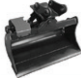
BENNA ORIENTABILE 45°