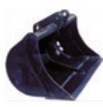
BENNA PULIZIA FOSSI

250 mm 300 mm 400 mm 500 mm 600 mm 700 mm