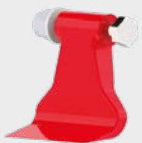
HF2 Ø max 5 cm DI SERIE