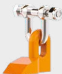
HC1 Ø max 4 cm